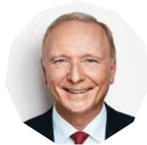
BERND WESTPHAL MdB