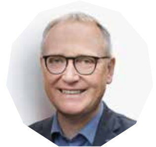
KLAUS MINDRUP MdB